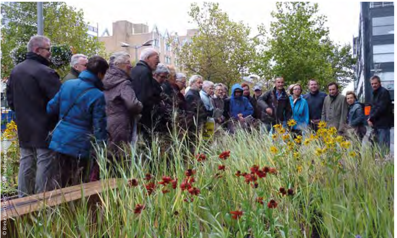
De restruimte en de overmaat van de huidige profielen kan dienen voor de teelt van energiegewassen zoals Panicum virgatum.