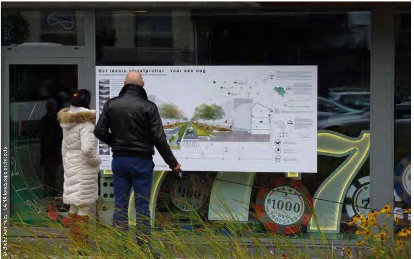
Een paneel informeert omwonenden over de mogelijkheden van Het Ideale Straatprofiel.