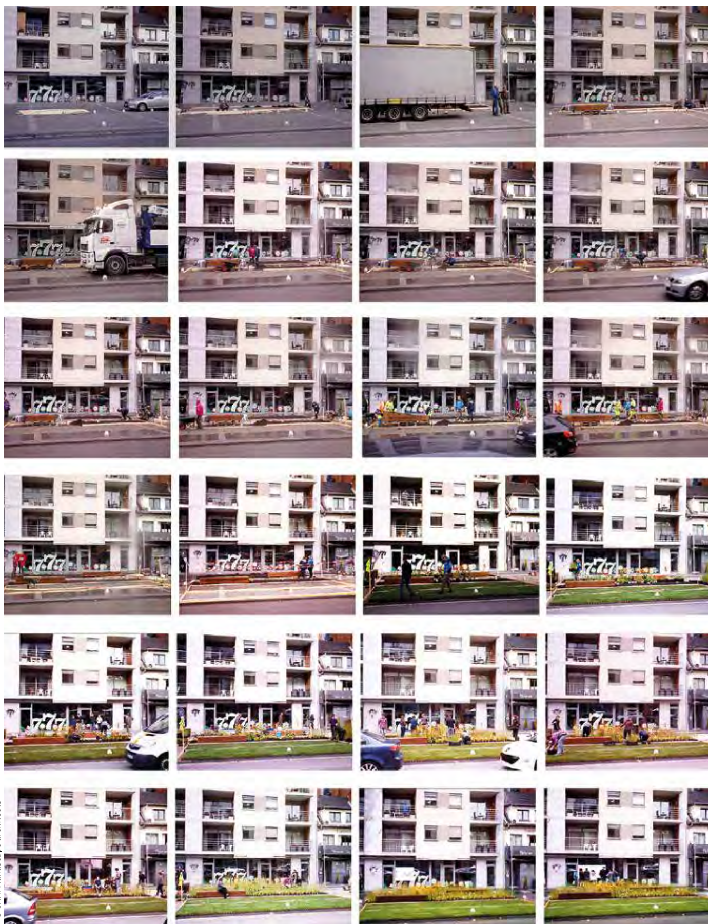
De ontwerpers bouwden de tijdelijke installatie in drie dagen op.