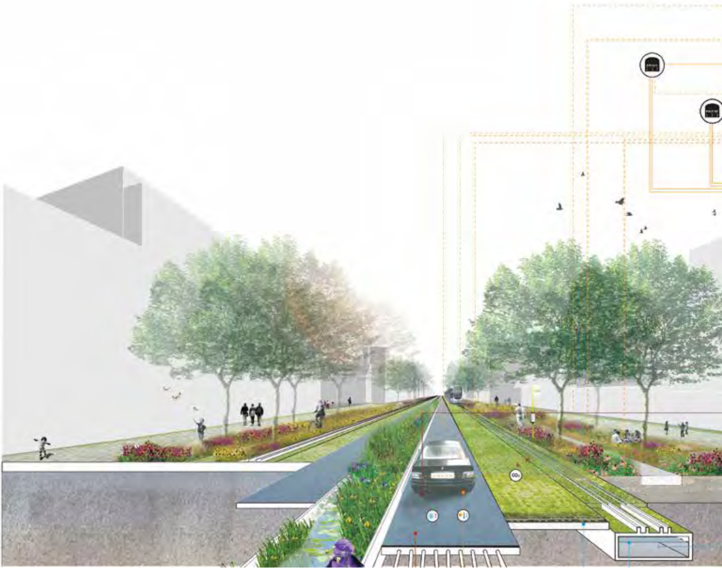
Het Ideale Straatprofiel toont hoe het wegprofiel omgevormd kan worden tot een multifunctionele, productieve en aantrekkelijke groene ruimte.