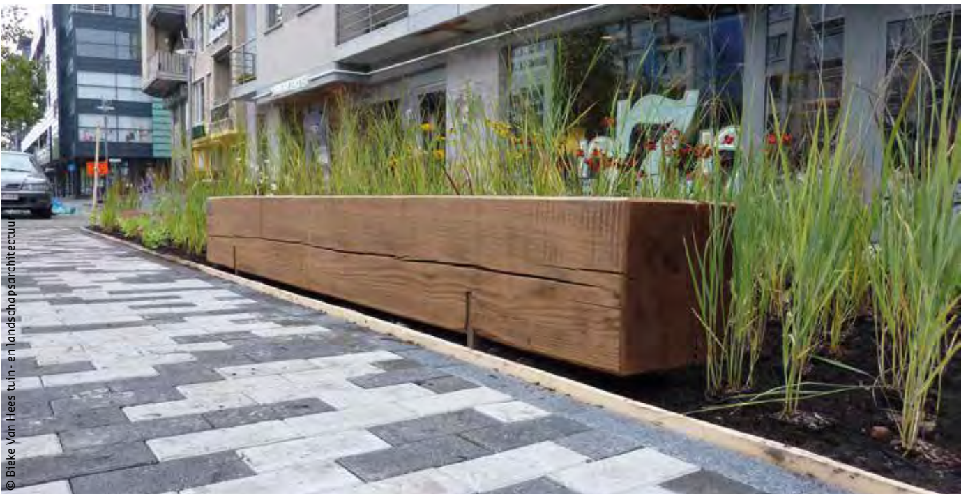
De verharding is waterdoorlatend en zorgt er ook voor dat schadelijk stikstofoxide wordt omgezet in niet-schadelijke nitraten.