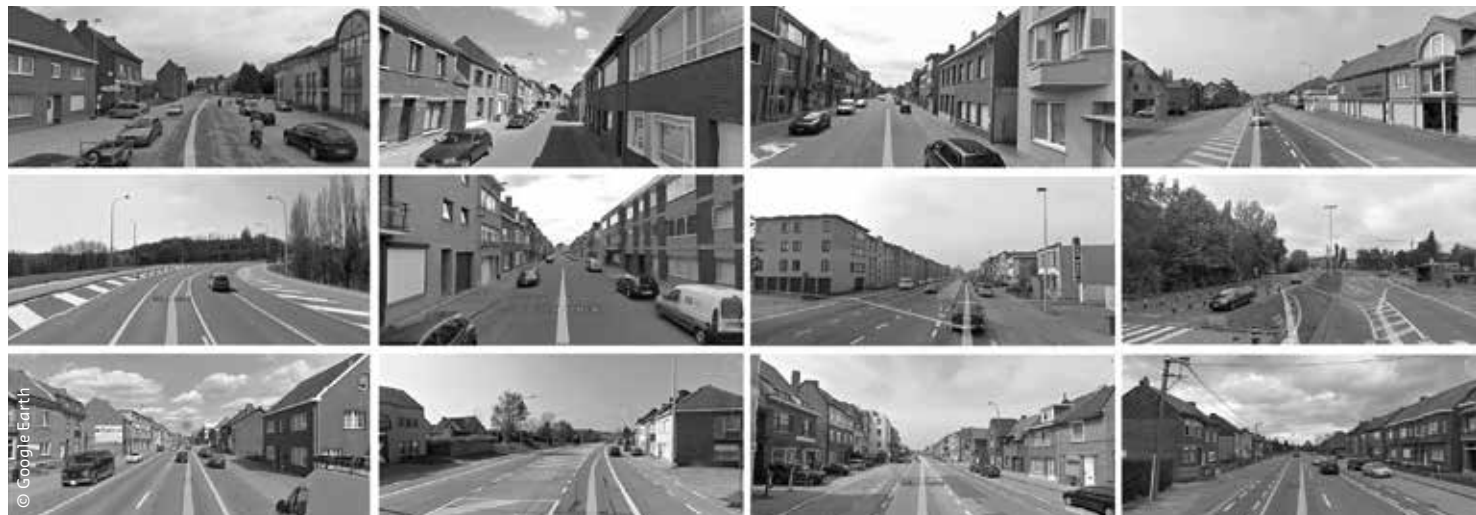
Stereotiepe beelden van het versteende Vlaanderen.

Dit is 1,3x de oppervlakte van het Brussels Hoofdstedelijk Gewest.