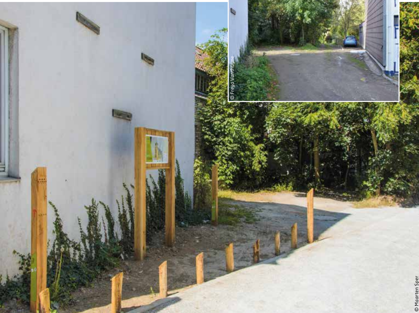
Een voorheen onherkenbare toegang tot een park is nu duidelijk aangegeven.

na een tijd tot een nieuwe solitaire bij. Opvallend was dat enkele weken na het plaatsen van de palen wilde bijen al een groot aantal gaatjes in gebruik genomen hadden. Op die manier voegen 'levende' wandelpalen natuurwaarde toe aan het deels verstedelijkte landschap. Op belangrijke punten langs de wandeltrajecten, zoals vertrekplaatsen, markante punten of de ingang van een park, staan grotere bijenpalen. De motieven op die palen doen denken aan een totempaal.